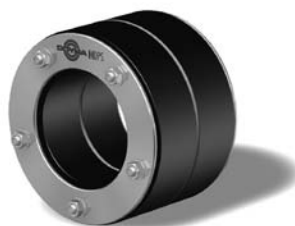
Curaflex® C 40

z. B. für besonders empfindliche Medienrohre, mit 40 mm dickem EPDM, Stahlteile: ggV