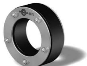
Curaflex® A 40

x x x Werte bis Rohraußendurchmesser 288 mm, siehe Seite 2